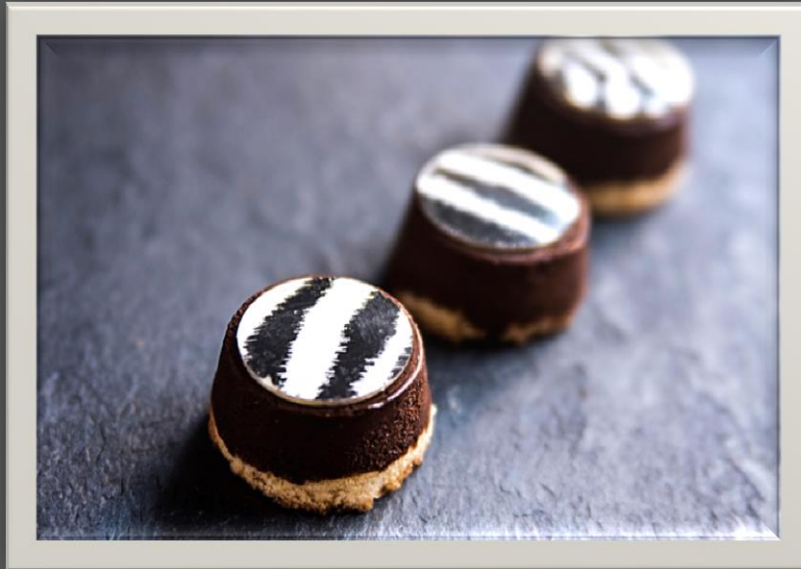
"MINI FONDANT DE CHOCOLATE"