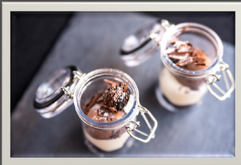
"MINI BLACK FORREST"

un ejemplo de como todos los clásicos se pueden transformar en divertidos y llamativos vasitos