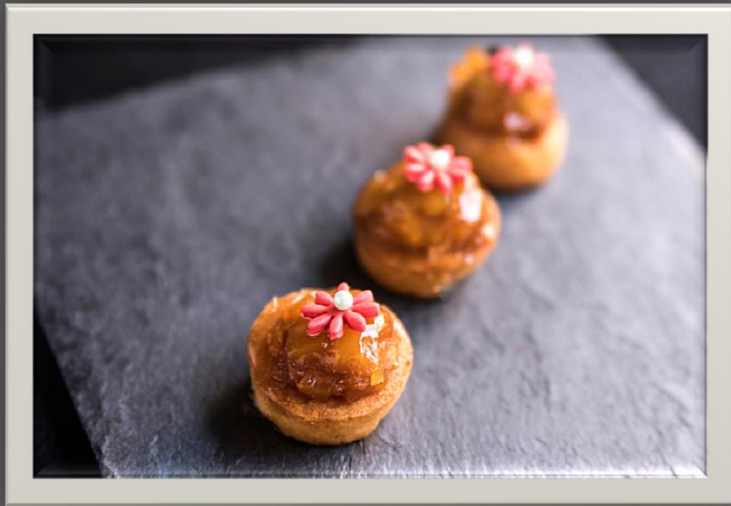
"TATEN DE MANZANA"